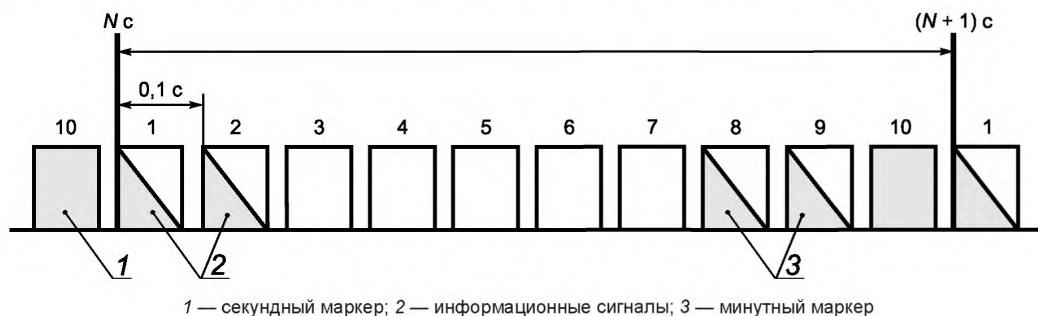
Рисунок 1 — Информационная структура сигнала

4.2 Элементы кода передают раз в секунду путем модуляции несущих колебаний в первом и втором 0,1-секундных интервалах, отсчитываемых от секундного маркера (см. рисунок 1).