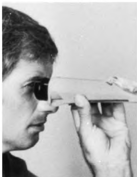
Рисунок 4 — Снятие показаний

Примечание 3 — Температурная шкала прибора обратна шкале стандартных термометров. Значения отрицательных температур расположены в верхней половине шкалы.