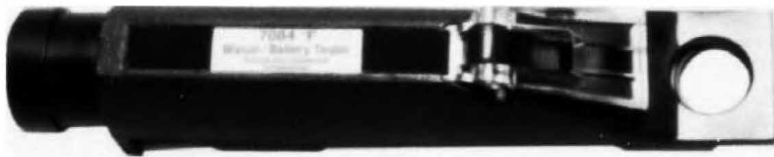
Рисунок 1 — Ручной рефрактометр предельного угла

6.2 Телескопический утопленный окуляр находится на одном конце, а полупрозрачная призма — на противоположном (см. рисунок 1).