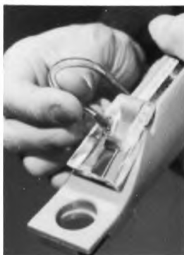
Рисунок 2 — Очистка прибора