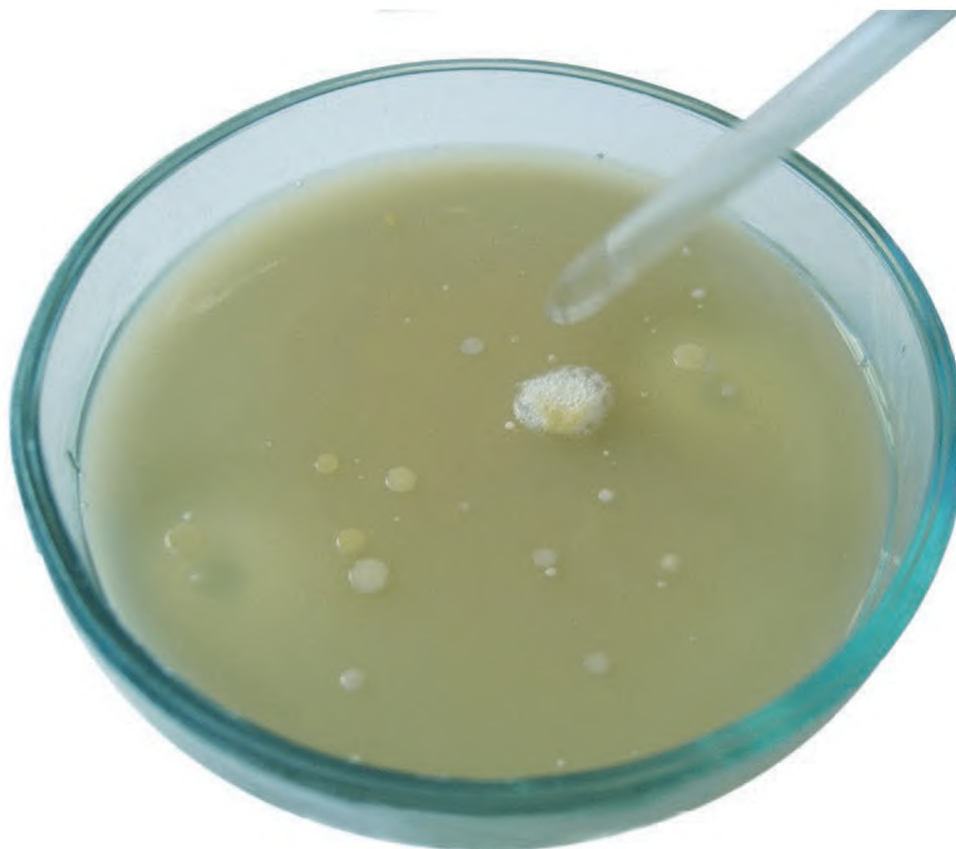
Рисунок Б.1 — Вид колоний солеустойчивых микроорганизмов. Реакция на каталазу — разложение перекиси водорода с выделением газа

Б.1 Вид колоний солеустойчивых микроорганизмов при определении каталазной активности приведен на рисунке Б.1.