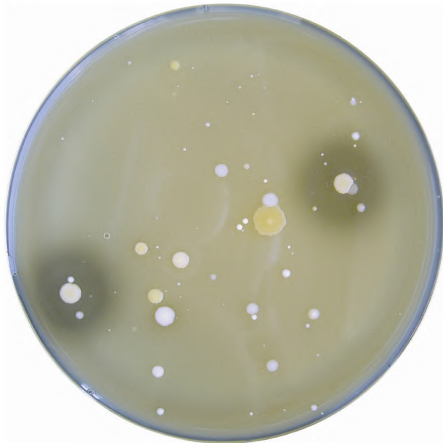
Рисунок А.1 — Вид колоний солеустойчивых микроорганизмов

А.1 Картина роста солеустойчивых микроорганизмов приведена на рисунке А.1.