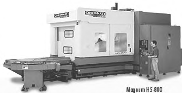
Рисунок В.1 — Пример сочетания ресурсов, составляющих полезный ресурс

На рисунке В.2 приведен другой пример — сборочный цех, в котором находится ряд сборочных уста-