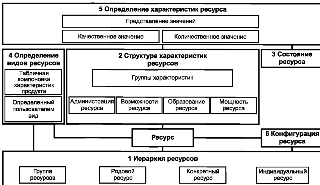
Рисунок 1 — Общее представление информационной модели ресурсов

Примечание — Примеры конкретизации концептуальной информационной модели для управления использованием ресурсов приведены в приложении В.