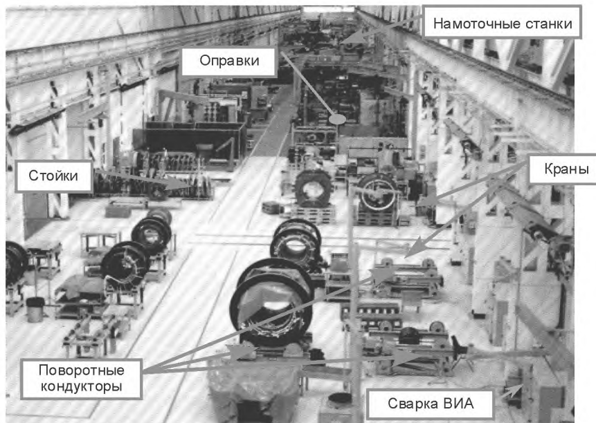
Рисунок В.2 — Пример сборочного цеха